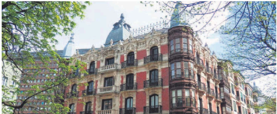
DESDE SU SEDE EN RAMPAS DE URIBITARTE, EL COLEGIO LLEVA A CABO UNA AMPLIA Y VARIADA ACTIVIDAD PROFESIONAL Y CULTURAL.

«EL COLEGIO DEBE SER UN INSTRUMENTO ÚTIL A LA HORA DE DEFENDER LOS INTERESES DE SUS MIEMBROS»