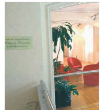
SALÓN DE ACTOS DEL COLEGIO DE ABOGADOS.